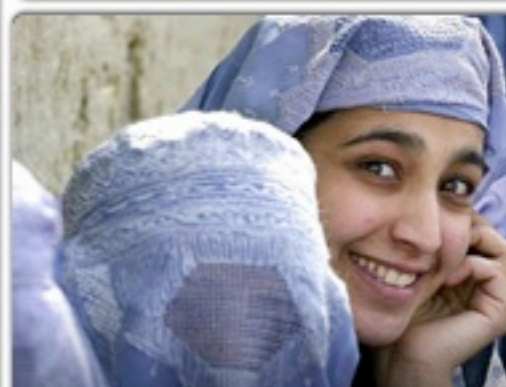
Obtenga reproducciones y cuadros de las mejores fotos de AFP